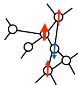
図2 グラフ上の局所的な共分散構造の概念図。(実際にはより巨大な)グラフの一部で各ノード(例えばタンパク質)が協調的に変動(増減)する。